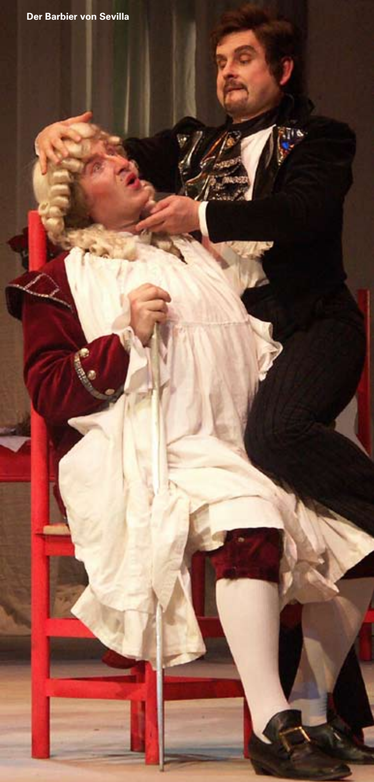
Der Barbier von Sevilla