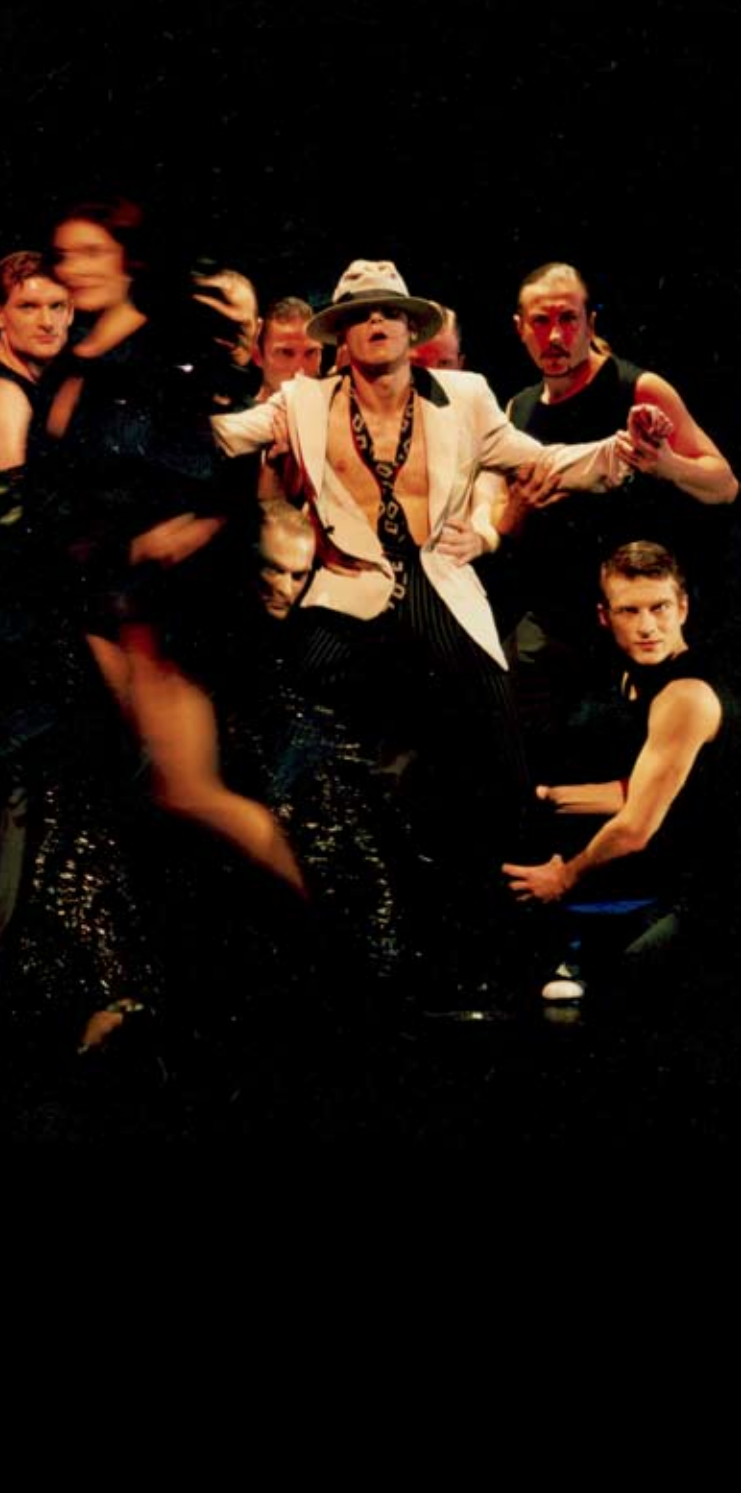
The Who's Tommy