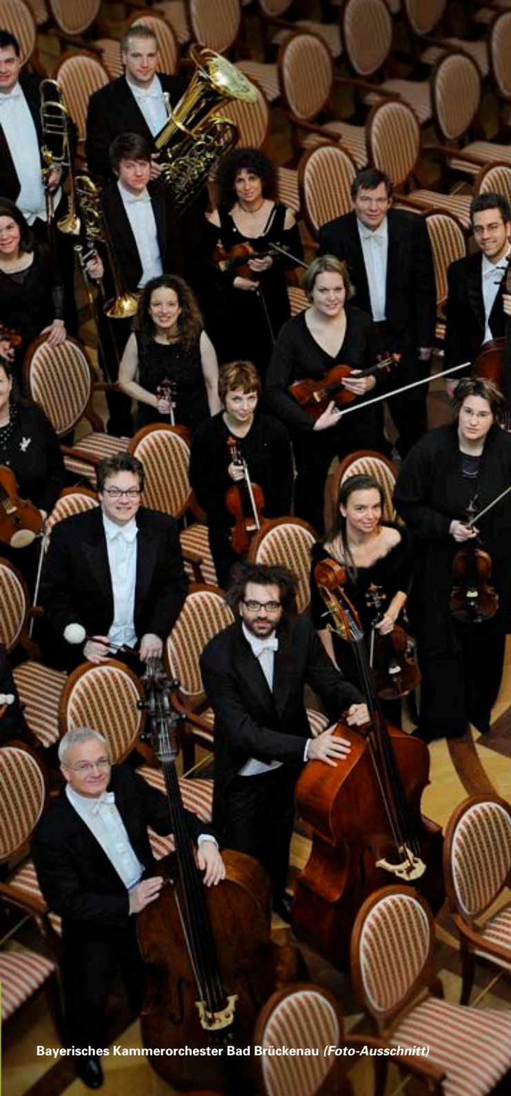
Bayerisches Kammerorchester Bad Brückenau (Foto-Ausschnitt)