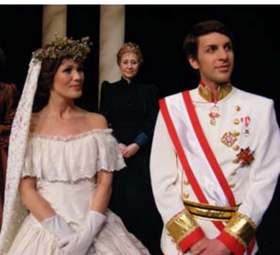
Sissi – Ihre wahre Geschichte