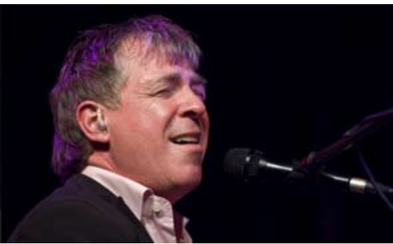
One Piano – One Voice