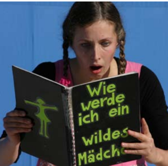
Starke Kerle, wilde Mädchen