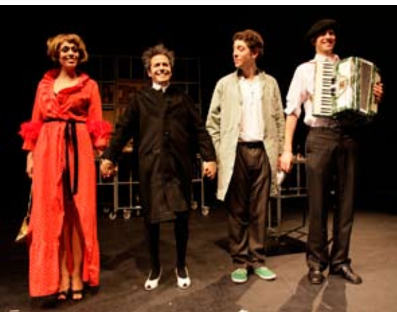
Monsieur Ibrahim et les fleurs du Coran