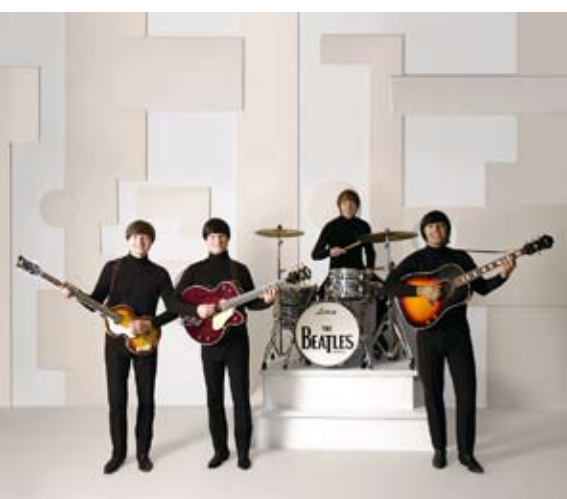
The Beatles Story performed by The Beatles Revival