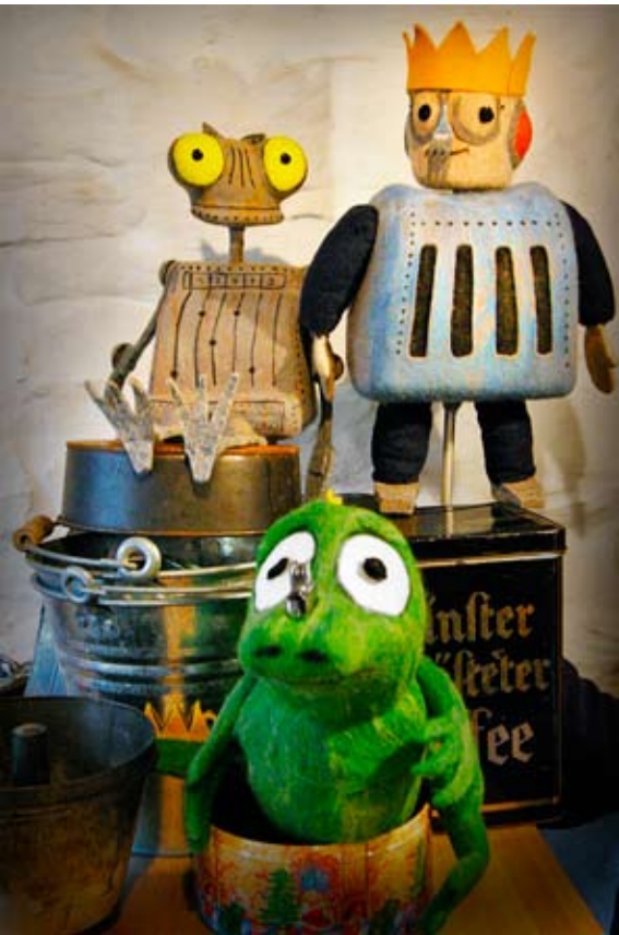
Ritter Rost feiert Weihnachten