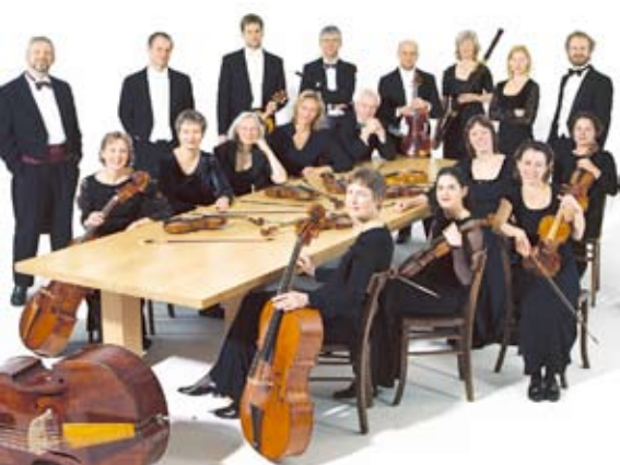
La Stagione Frankfurt