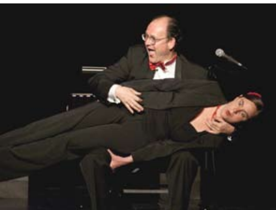
Don Giovanni à trois