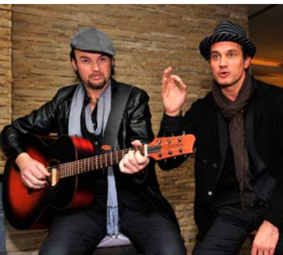
Bauer in Love