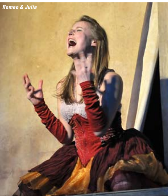
Romeo & Julia