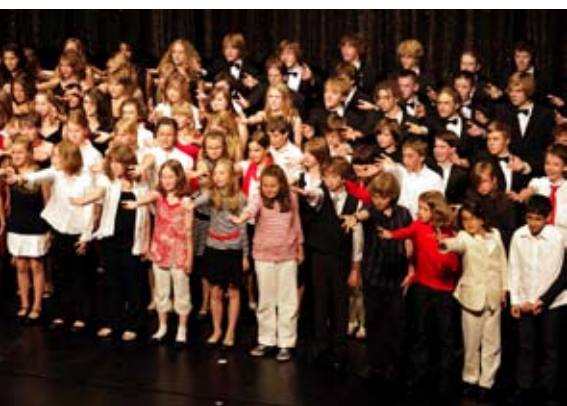
Hilfe nach Noten: Chöre der Kantschule

18.12.2010 | Samstag | 19 Uhr | Großes Haus – Veranstalter: Turnus Konzert- und Theateragentur, Rainer Zagovec