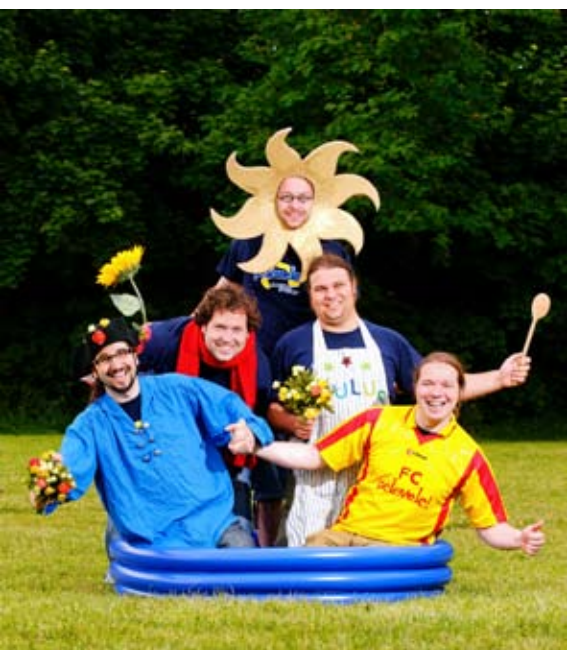
Pelemele – Rockmusik für Kinder