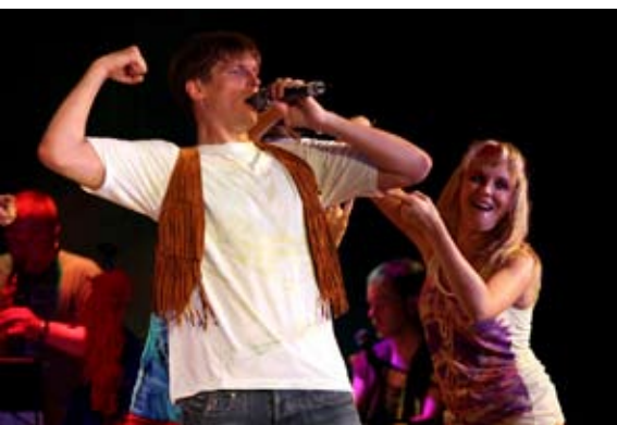
Here Comes The Sun