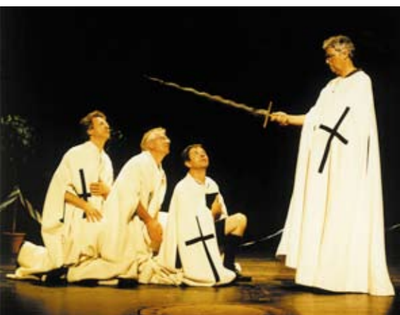
Gerhard Polt und die Biermösl Blosn