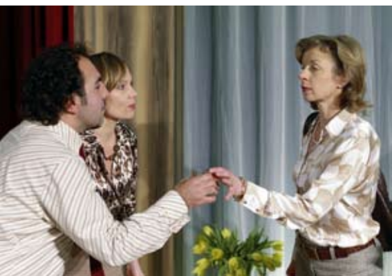
Der Gott des Gemetzels