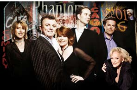
The London West End Gala