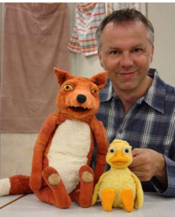
Alle seine Entlein...