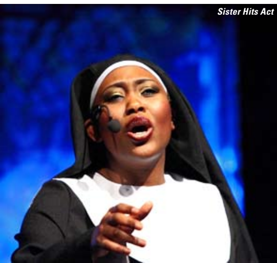
Sister Hits Act