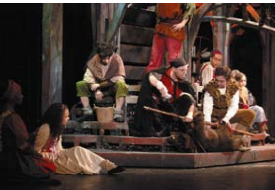
Tintentod - Das Musical