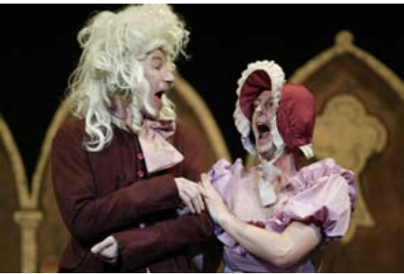
A Christmas Carol