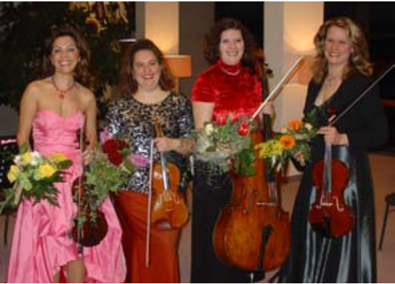
Festliches Weihnachtskonzert „Philharmonic Stars“