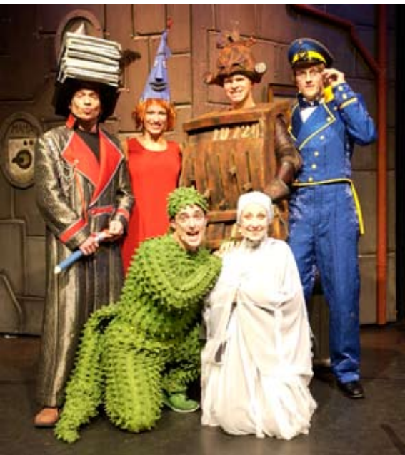
Ritter Rost und das Gespenst