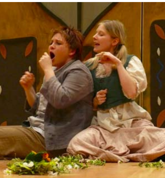
Hänsel und Gretel