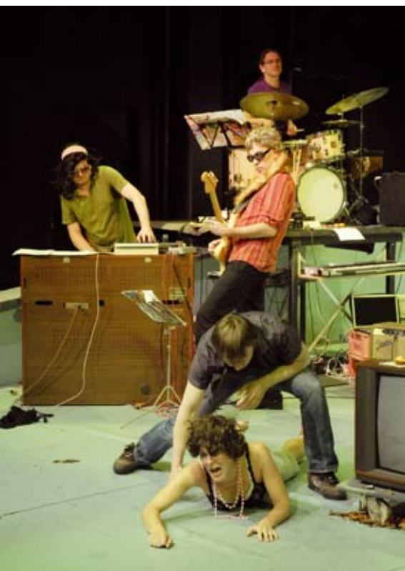
Jesus von Texas