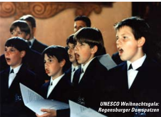
UNESCO Weihnachtsgala: Regensburger Domspatzen