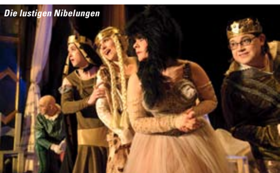
Die lustigen Nibelungen