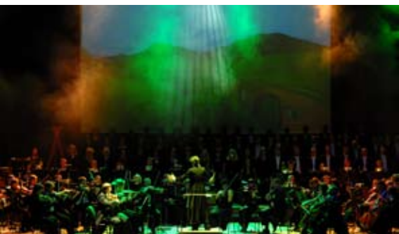
Das Beste aus Klassik & Film